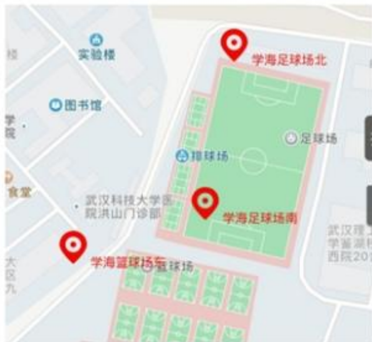
南湖校区北院途径打卡点