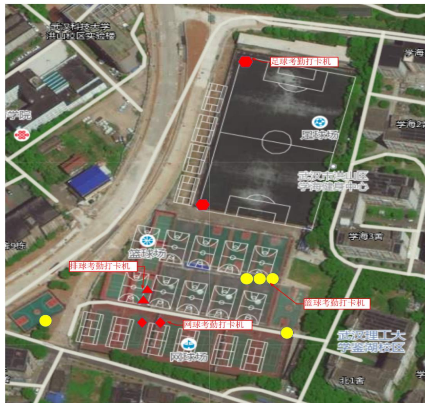
鉴湖校区打卡机点位分布：