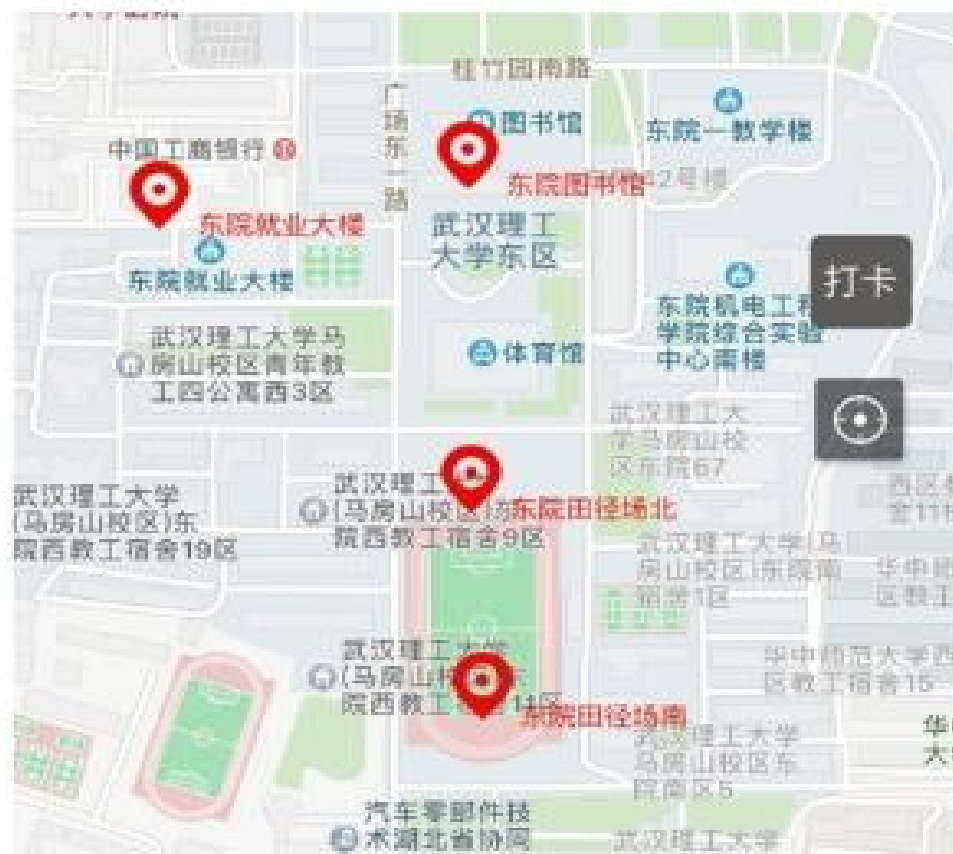
马房山校区东院途径打卡点