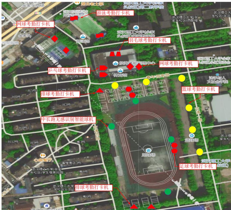
余家头校区打卡机点位分布：