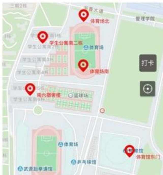
南湖校区南院途径打卡点