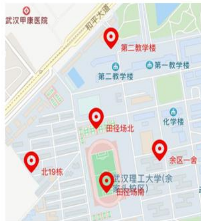
余家头校区途径打卡点