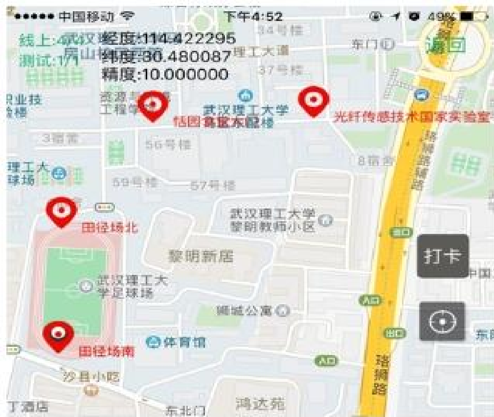
马房山校区西院途径打卡点